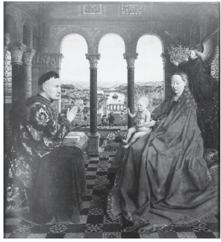
ヤン・ファン・アイク 《宰相ロランの聖母》