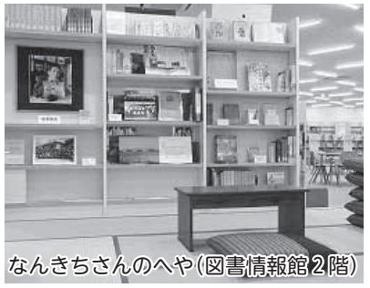
なんきちさんのへや(図書情報館2階)