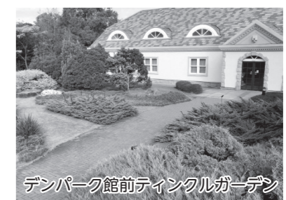
デンパーク館前ティンクルガーデン