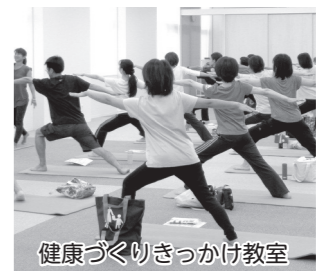
健康づくりきっかけ教室