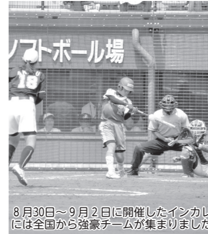
8月30日～9月2日に開催したインカレには全国から強豪チームが集まりました

■国際・全国大会推進活動事業 2020年東京オリンピックの合宿誘致を主として、2026年アジア競技大会等の大規模な国際大会の誘致、全日本大学女子ソフトボール選手権大会(インカレ)や日本リーグ等の開催により、市民のスポーツに対する興味や関心を高めめます。