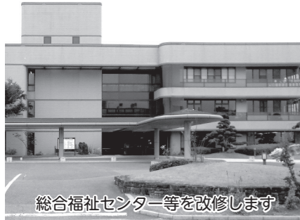
総合福祉センター等を改修します