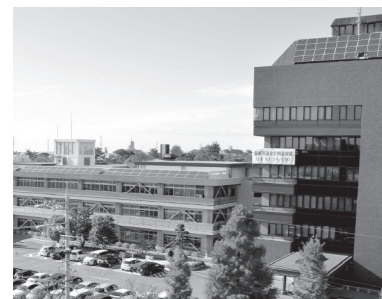
左:市役所本庁舎(昭和41年建築) 右:市役所北庁舎(昭和60年建築)