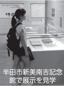
半田市南美南吉記念館で展示を見学

大変だったのは、人に会ったり調べたりする楽しい時間の後に待っている、模造紙に文章を書く作業。最終的に8枚もの分量になりました。何度も書き直したので毎回消しゴムのカスの量がすごいことに！40日間毎日研究に取り組んで、完