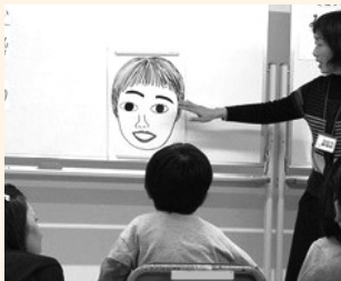
SSTの一コマ「皆で福笑いを完成させよう！」

としたらダメでしょーと しか言っただけです。 ステップ先生 このスキ ルは、家庭よりも集団生 活で身につくものが圧倒 的に多いんです。こうい う場面ではこうするとう まいくよ」と丁寧に伝 えることが大切。成功体 験を積み重ね、自信を育 てることで、とても生き やすくなるはずですよ。 ママ 普段家庭でもでき ることはありますか？ ステップ先生 良い行動 をしたときは、積極的に ほめましょう！自己肯定 感や自信・意欲につなが り、他者を思いやる気持 ちが芽生えますよ。