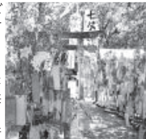
笹の参道(七夕神社)

七夕神社では、十月にミュージカルが上演される拙作『神様の願いごと』の表紙を再現してくださった「笹の参道」も見物しました。多くの願いごとに囲まれながら、日頃のお礼と共に、神社の神様へミュージカルの成功をお祈りしてまいりました。