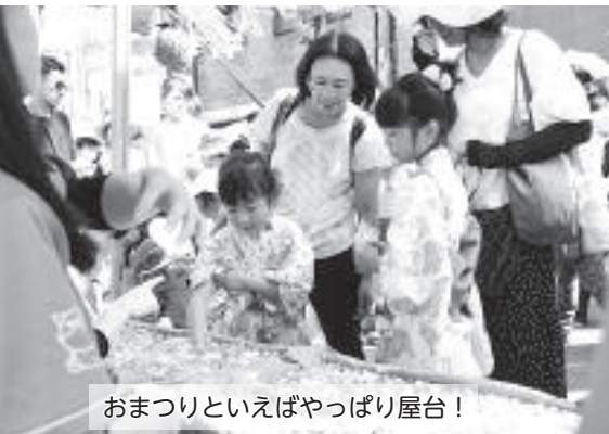
おまつりといえばやっぱり屋台！

人気のダンスイベント「DanSpo ANJO」や大盆踊り大会では、 子どもから大人まで多くの人達が踊りに参加しました。