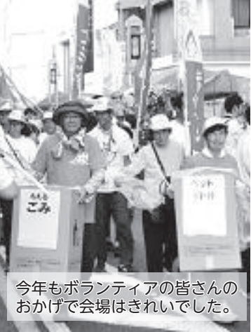
今年もボランティアの皆さんのおかげで会場はきれいでした。