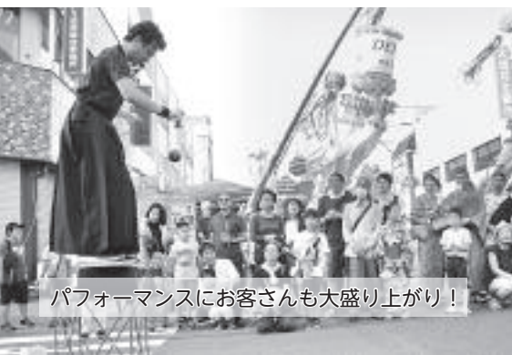
パフォーマンスにお客さんも大盛り上がり！