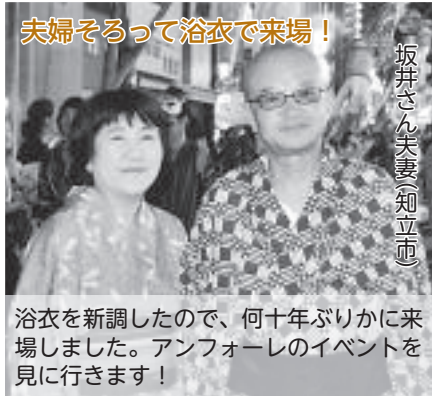
夫婦そろって浴衣で来場！