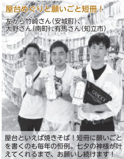
屋台めぐりと願いごと短冊！