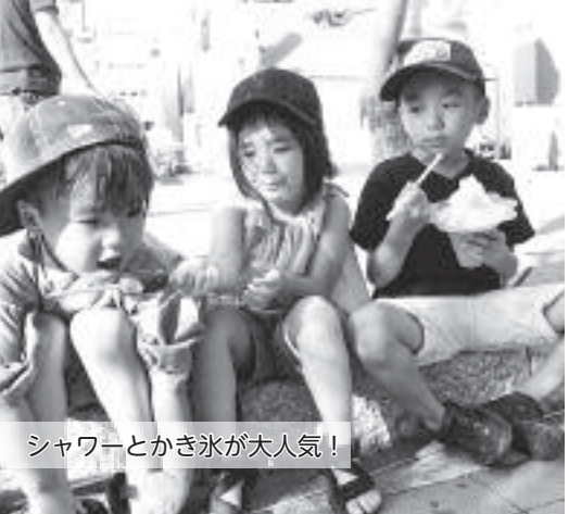
シャワーとかき氷が大人気！