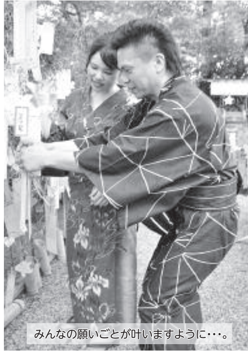
みんなの願いごとが叶いますように…。