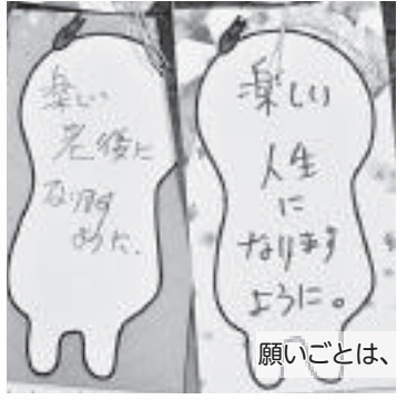
願いごとは、人それぞれ。