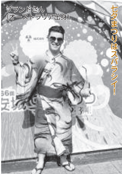
ブランドさん (オーストラリア出身)

家族みんなで風船を飛ばしたよ。風船がいっぱい飛んでいく様子がとてもきれいだった！