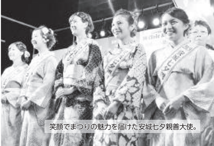
笑顔でまつりの魅力を届けた安城七夕親善大使。