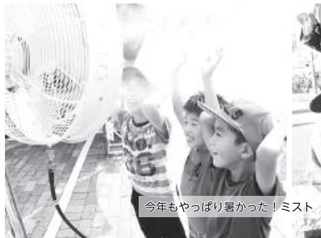
今年もやっぱり暑かった！ミスト