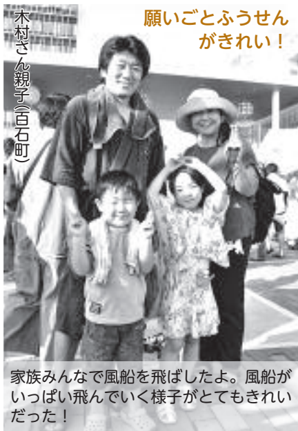
願いごとふうせん がきれい！

浴衣を新調したので、何十年ぶりに来場しました。アンフォーレのイベントを見に行きます！