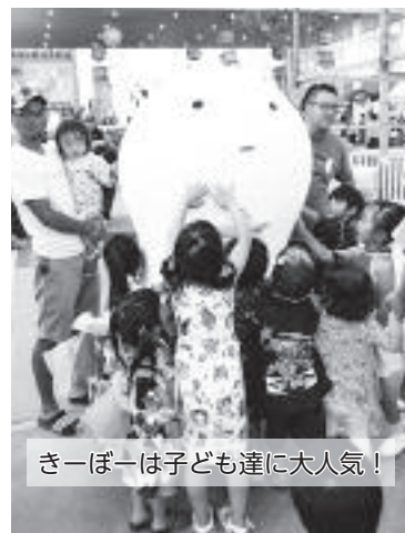
きーぼーは子ども達に大人気！