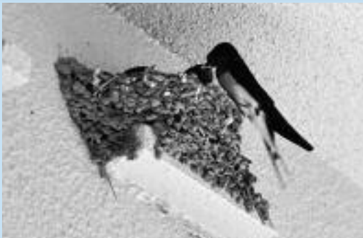
桜井保育園軒下のツバメの巣

安城のまちも都市化が進み、ありのままの自然はなくなり、季節感が失われてきているように思われます。それでもよく注意をすれば、季節の移ろいを実感できる風景や現象を目にすることができ、私たちの暮らしが自然のサイクル内に置かれているということが実感されます。