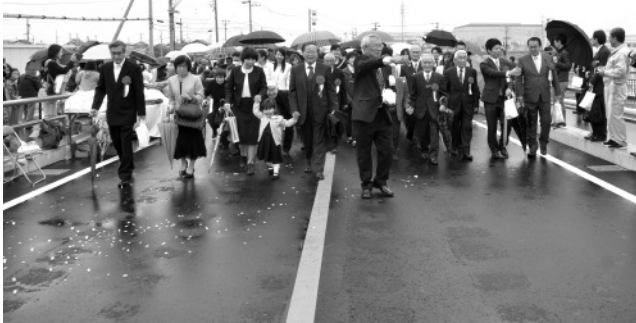
にしがい わたりぞ 西海橋渡初め式