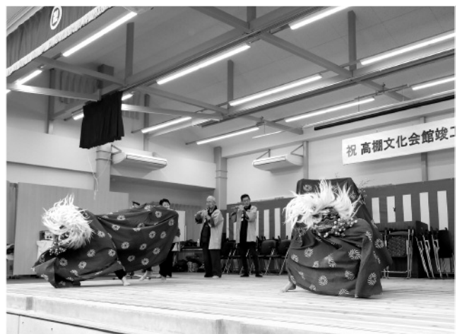
高棚文化会館竣工式

日 3月12日 場 市役所 昨年5月25日から200日間のラリーを実施。無事故無違反を達成した中学校4校(明祥・桜井・安祥・篠目)と高等学校等2校(安城生活福祉高等専修学校・安城特別支援学校高等部)が表彰を受けました。