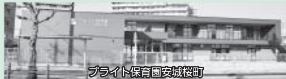
ブライツ保育園安城桜町

急増する保育需要に対応するため、民間保育園等を誘致します。今年度はブライツ保育園安城桜町(桜町)、麦のうさぎ保育園(堀内町)がともに4月に開園します。また、民間保育園の運営、施設の改修、設備の拡充を支援します。