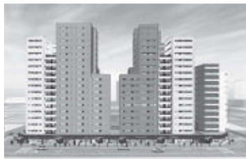
南明治地区(末広町)の整備イメージ