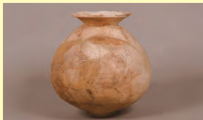
人面文壺形土器(本館蔵)