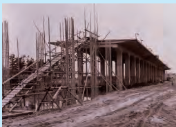
建設中の東海道新幹線 (安城南中学校附近、本市蔵)

今回の特別展では東京オリンピック開催の「1964年」にスポットを当て、当時の人々の暮らしを紹介します。