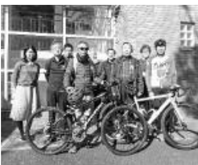
▲ワークショップメンバーの皆さん