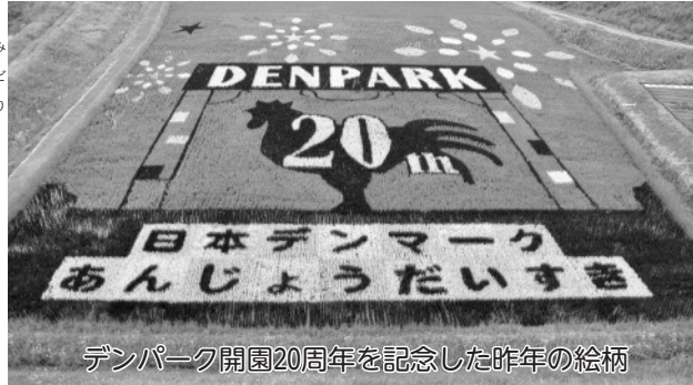
デンパーク開園20周年を記念した昨年の絵柄

②JAあいち中央営農企画部(〒446-10046 赤松町浄善50/FAX(73)4415)