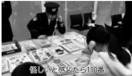
怪しいと感じたら110番

安城市の犯罪発生件数は、ピークだった平成15年以降減少傾向にあります。空き巣、振り込め詐欺、わいせつ事案等の生活に身近な犯罪が、平成29年は1477件も発生しています。自分でできる、被害に遭わないための方法・手段を考え、近所でも声を掛け合い、みんなで対策を実践しましょう。