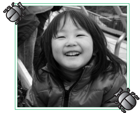
「かぶと虫幼虫掘り体験」で見つけた、すてきな笑顔

2011年プラネタリウム夏番組 迷？探偵クリスPart 8 歴史博物館企画展 汽笛一聲・安城駅120年