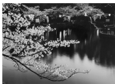
小澤昌平さんの作品