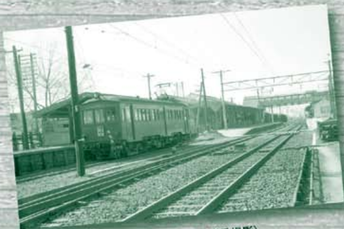
昭和36年(1961年)の安城駅