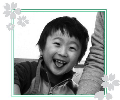
「いがまんじゅうをつくろう」で見つけた、すてきな笑顔