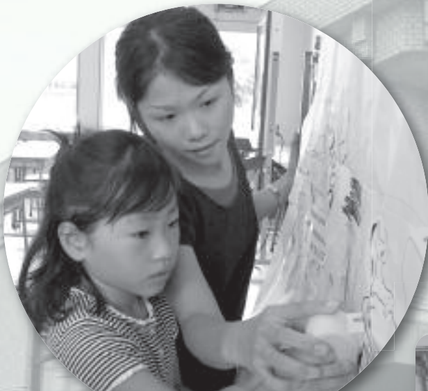
見て・触れて・学べる展示

問▶環境首都推進課(☎く71>2206) 秋葉いこいの広場(☎く76>7148)