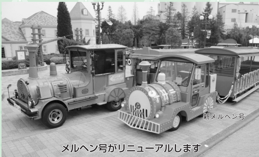
メルヘン号がリニューアルします