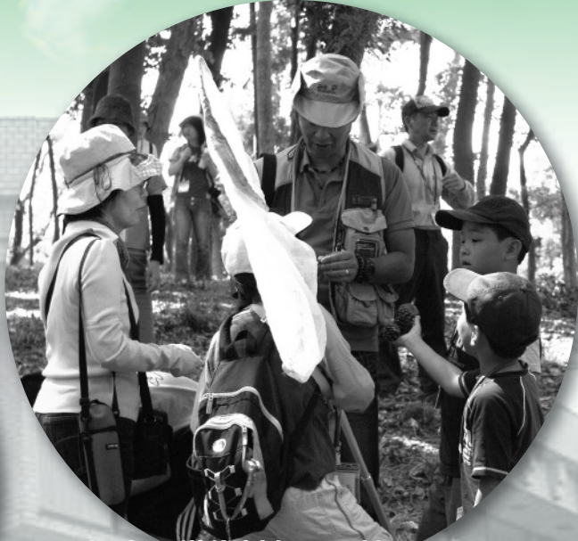
幅広い世代対象の環境イベント