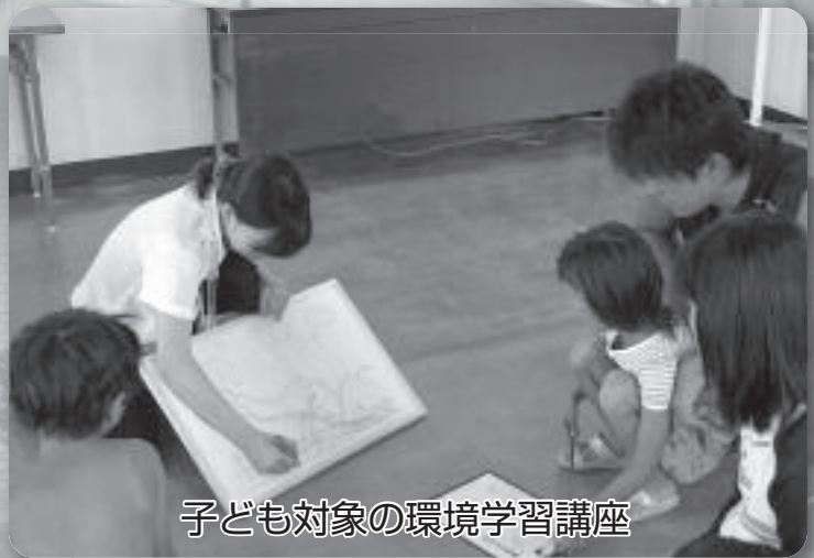
子ども対象の環境学習講座