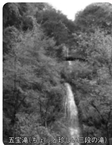
五宝滝(ちょっと珍しい三段の滝)