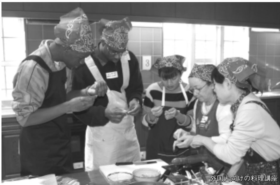
外国人向けの料理講座