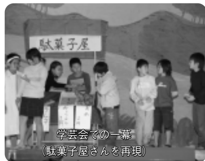
学芸会での一幕 (駄菓子屋さんを再現)

そして、101回生となる彼らは「わたしたちは今までの中部小のよき伝統を引き継ぎ、これからの新しい中部小を作っていきたいと思います」と、誇らしげに誓いの言葉を宣言しました。