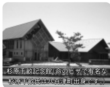
杉原千畝記念館(命のビザで有名な杉原千畝氏は八百津町出身です。)