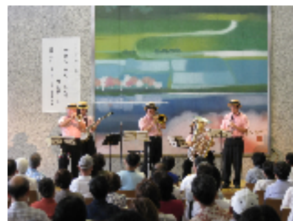
ミュージアム・コンサート 「デキシールランドジャズ・ コンサート」

開館時間 午前9時～午後5時 (入館は午後4時30分まで) 休館日 月曜日(祝日の場合は、開館) 国民の祝日の翌日(土・日曜日、休日の場合は、開館)、土曜日が祝日のときは直後の火曜日、年末年始 常設展観覧料 個人 200円(団体160円) 中学生以下は無料