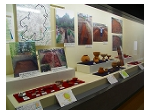
埋蔵文化財センター展示室

平成20年度の調査のうち、姫塚古墳・本神遺跡・塔之元遺跡・惣作遺跡・桜林遺跡の発掘調査で明らかとなった成果を、出土物等を中心に、写真パネル等も交えて展示した。また、調査成果をわかりやすく解説した一般向けのリーフレットを作成して配布し、普及啓発に努めた。