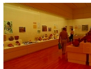
安城発掘のあゆみ展

また、今までの市内遺跡の調査の成果を遺跡ごとにまとめて「安城発掘のあゆみ展」として市民ギャラリーC室において展示した。今回は堀内貝塚・御用地遺跡・本神遺跡・鹿乗川流域遺跡群・二子古墳・姫小川古墳を時代順に紹介した。