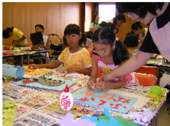
手づくりかみしばい教室