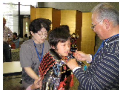
体験講座「鎧の試着会」

所在地 安城市安城町城堀30番地 竣工 平成2年8月31日 開館 平成3年2月8日 構造 鉄骨鉄筋コンクリート造3階建 敷地面積 20,260.04㎡ (市民ギャラリー・安祥公民館敷地含む) 建築面積 2,403.72㎡ 延床面積 4,851.69㎡ 1階 2,115.55㎡ 2階 1,814.08㎡ 3階 922.06㎡