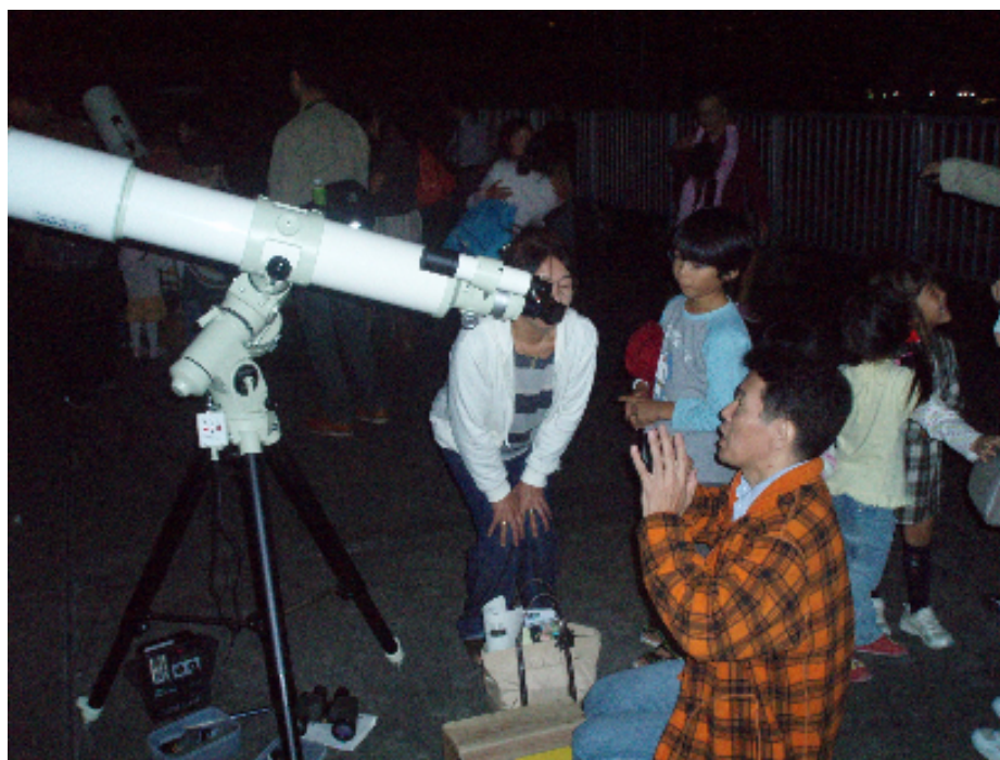
星空ウォッチング