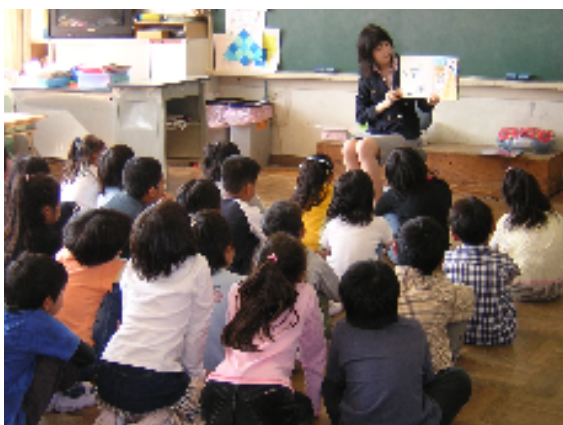
専門職員による 小学校での出前おはなし会

「図書館だより・ぱびるす」や「こどもとしょかんだより」、「絵本通信」、「新着図書情報」などを定期的に作成し、利用者に配布している。