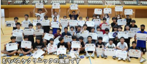
8/9バスケクリニックの風景です

アリーナやまちのことを知り、考えながら、「自分事」としてアリーナでチャレンジしたいこと、こんな場所になるといいなを、ワークショップで考え、体験し、ワクワクをみんなでつくっていくものです。 シーホース三河の本拠地であり、みんながつかえるアリーナができる前に、アリーナのことを考えることができる、唯一の機会です！