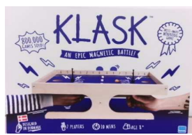
クラスク(小学生以上)