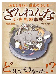
ざんねんな いきもの図鑑