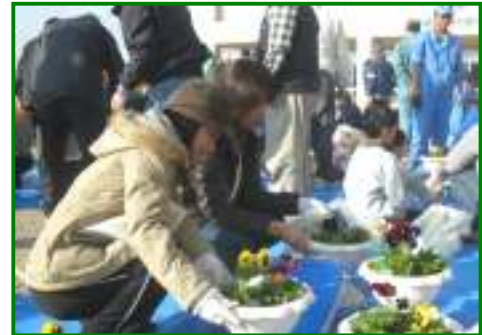
愛情を込めたフラワーポットの作成

現在、花育てをしながら、子どもたちへの見守りの目、地域コミュニティの輪の拡大に努めています。