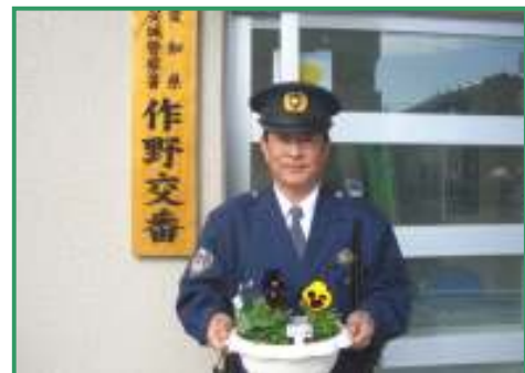
管轄交番のおまわりさんも参加

花づくりと防犯が結び付き、子どもの安全、防犯活動の輪が大きく広まるよう期待しています。