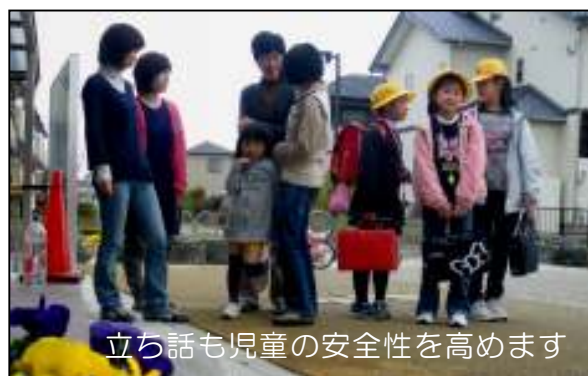
立ち話も児童の安全性を高めます