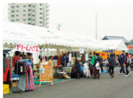
どんじゃらまつり

市民参加型の環境調査やイベントが行われています。 安城市の環境の状況並びに環境の保全や創造に関して講じた施策をまとめた「安城市環境報告書」を年1回発行しています。 広報あんじょうや市ホームページ「望遠郷」及びさまざまなイベントを通じて、環境情報を提供しています。